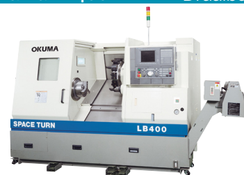
Okuma LB400-M Draaibank