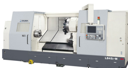
Okuma LB45-M Draaibank