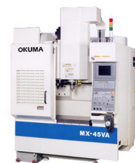
Okuma MX45-VAE Freesbank