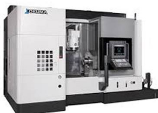
Okuma Multus U3000 Multitask