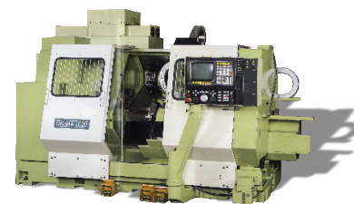
Okuma LC20 Draaibank