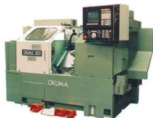
Okuma LB15 Draaibank