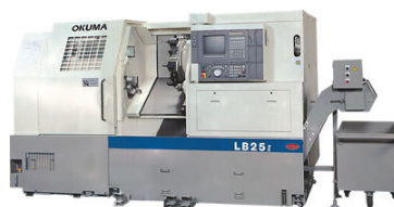
Okuma LB25 Draaibank