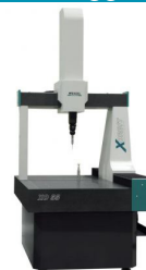
Wenzel X-orbit 55 Meten

• Voorzien van LNS Quickload stafaanvoer