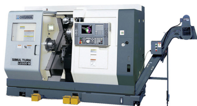
Okuma LU300-M Draaibank