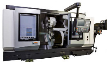
Okuma LU3000 + robot Draaibank