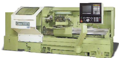
Okuma LS30-N Draaibank