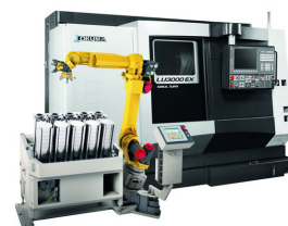
Okuma LU3000 + robot Draaibank