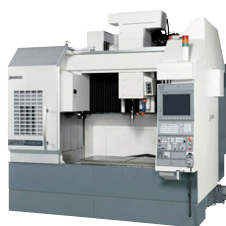
Okuma Genos M560R-V Freesbank